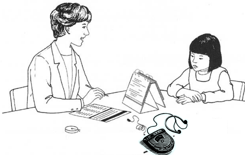
Obrázek 2-1: Doporučené uspořádání sezení při testování, je-li administrátor pravák

Nejvhodnější uspořádání při testování je v tzv. pozici „L“ na kraji nízkého stolu. Obrázek 2-1 ilustruje pozici pro administrátora, který je pravák.